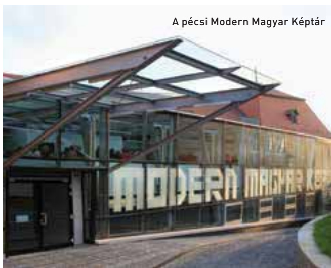
A pécsi Modern Magyar Képtár

múzeumok fontosságát mind a kormány, mind a városok látják, ám fenntartásukat egyelőre mindkét fél a másik kontójára hárítaná.