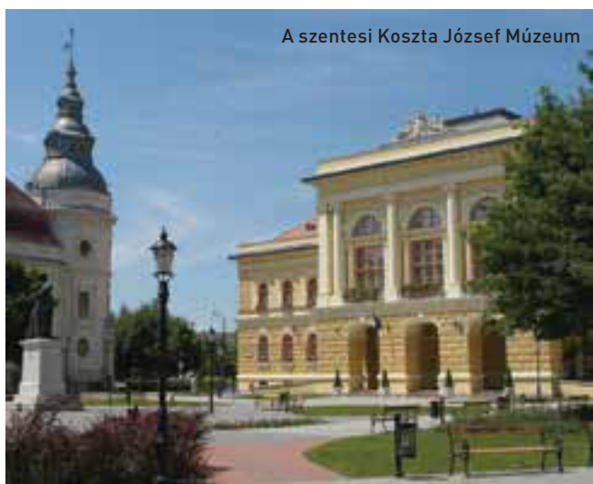
A szentesi Koszta József Múzeum