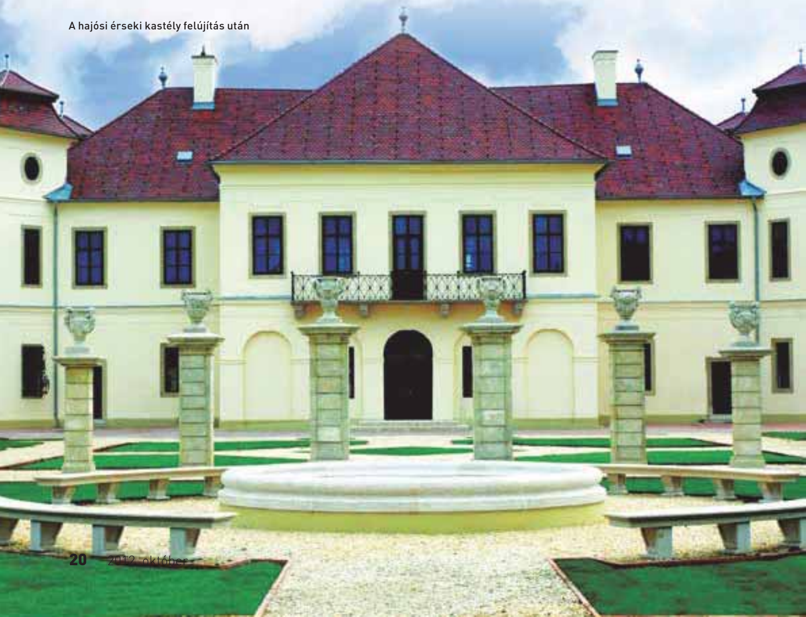
A hajósi érseki kastély felújítás után