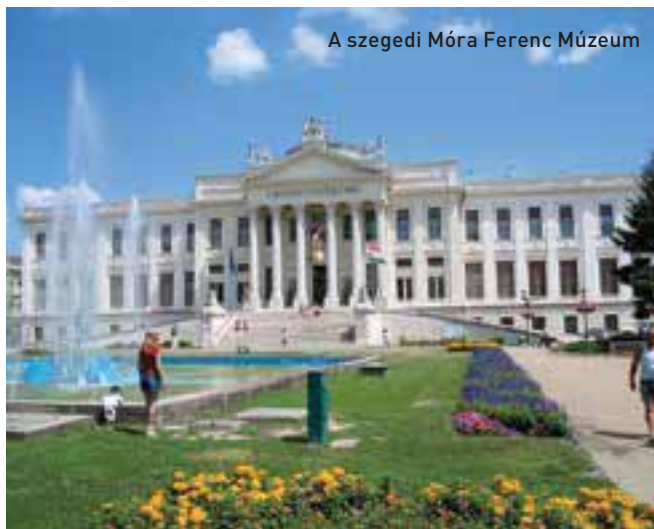
A szegedi Móra Ferenc Múzeum