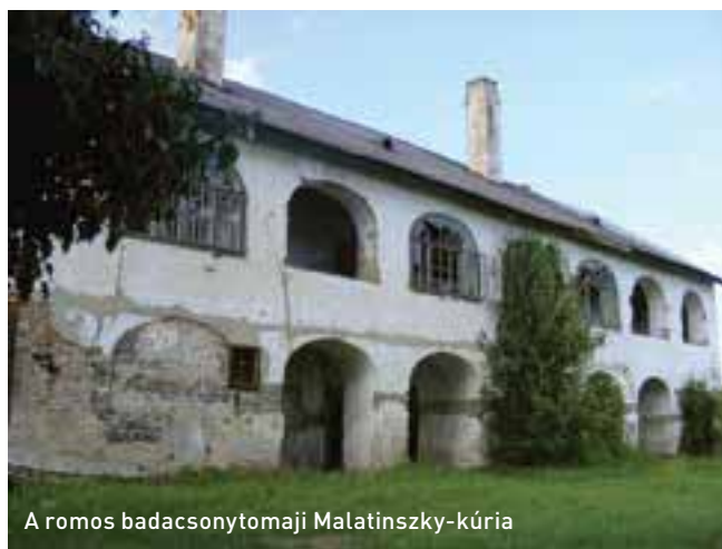
A romos badacsonytomaji Malatiniszky-kúria

Virág Zsolt szerint az utóbbi időben azonban jó hír például, hogy a turisztikai vonzerő-fejlesztési európai uniós pályázatok támogatási intenzitása 95-100 százalékos, vagyis ha van egy jó kidolgozott koncepció, akkor van esély arra, hogy akár önrész nélkül, európai uniós és hazai társfinanszírozással megtörténhessen műemlék épületek helyreállítása. Csakhogy rengeteg az ide kapcsolódó „de”!