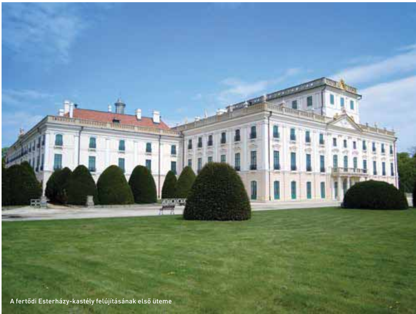
A fertői Esterházy-kastély felújításának első üteme