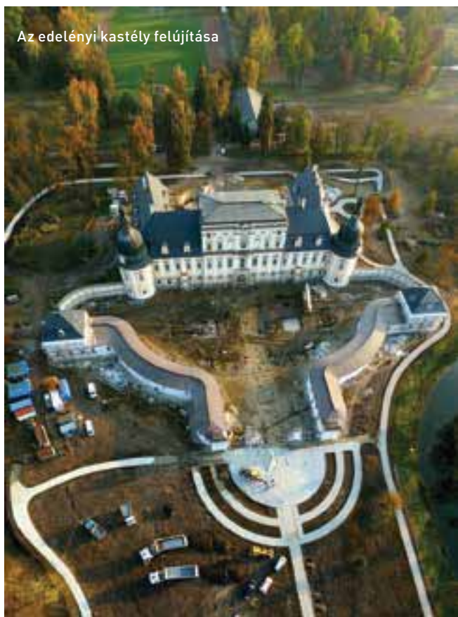
Az edelényi kastély felújítása

háború után megadatott nekik. Tágas, nagy belmagasságú termeik, egymásra felfűzött szalonjaik, művészi igényre kidolgozott, főúri reprezentációra hivatott részleteik, és főként a mai hőtechnikai igényeknek nem megfelelő tulajdonságaik miatt intézményként gazdaságosan nem üzemeltethetők. Műemlék mivoltuknál fogva nem alakíthatóak át szabadon, korszerűsítésük lényegesen drágább: 1,4-1,5-ös szorzóval nyugodtan lehet számolni egy olyan épület felújításának költségeihez képest, amelyet a funkcióknak és a műszaki szempontoknak megfelelően lehet renoválni.